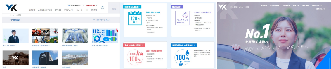
コーポレートサイト

採用に特化した専用ページを新たに新設。募集職種や働く先輩の紹介、産休取得率や男性の育休休暇、福利厚生などの情報を見やすくまとめています